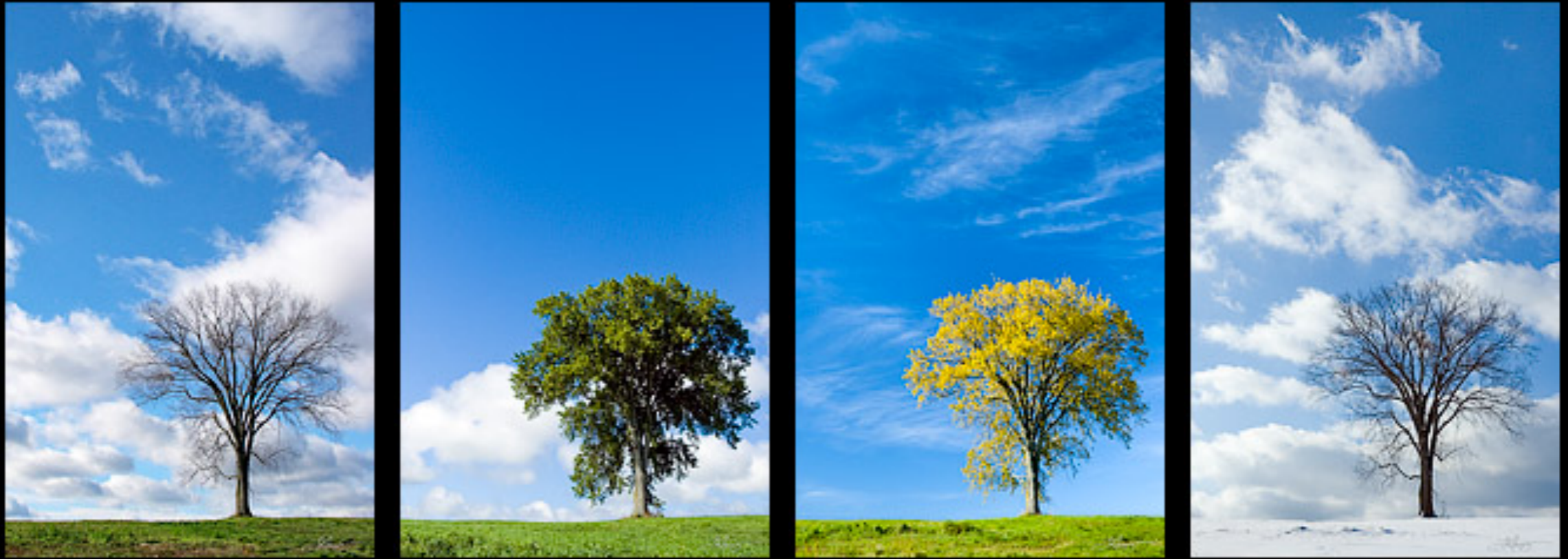
THE FOUR SEASONS TREVOR MORRIS PHOTOGRAPHICS