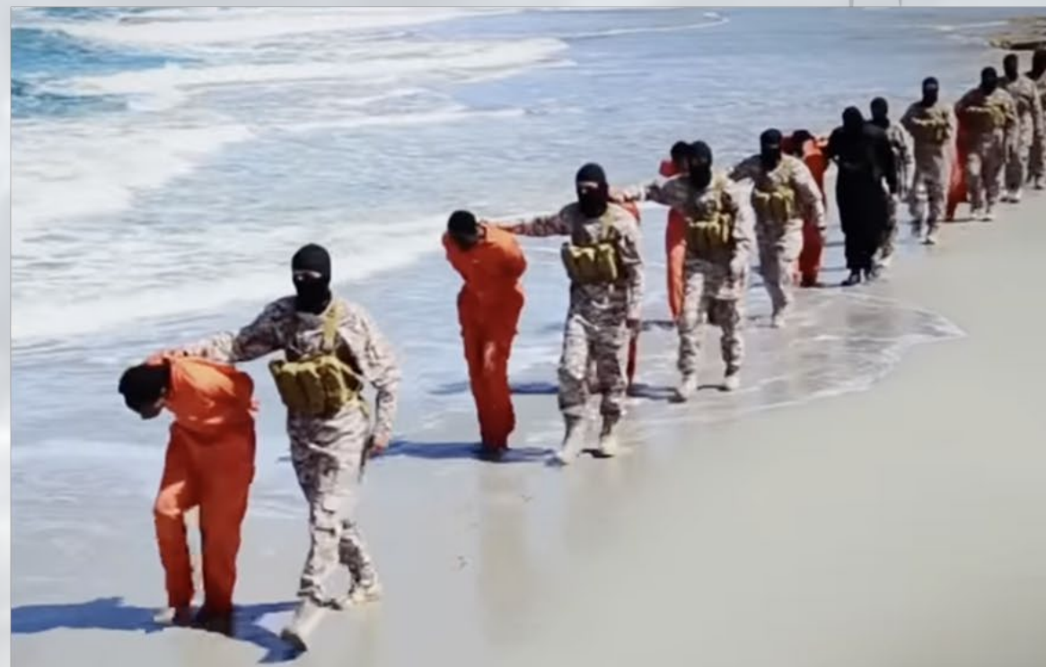
伊斯蘭國在2015年2月的敘利亞，處死21名埃及科普特基督徒