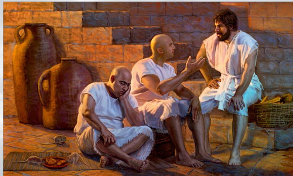
在埃及獄中的約瑟