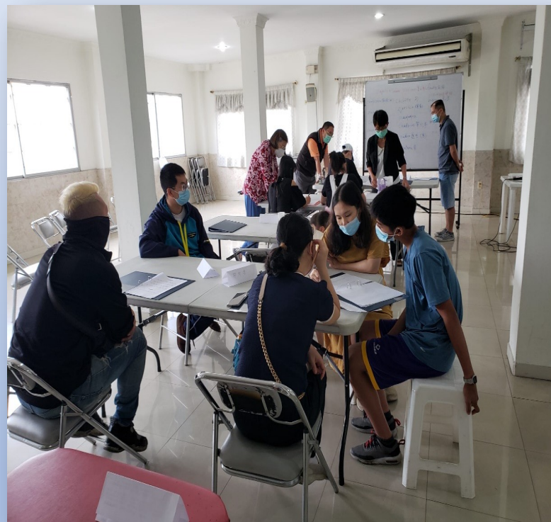
青少年教 西班牙語