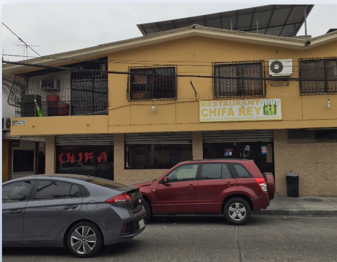
中國餐廳： ChiFa (吃飯)