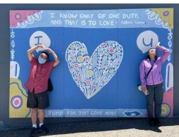
我們帶兒女去他們沒去過的沙灘