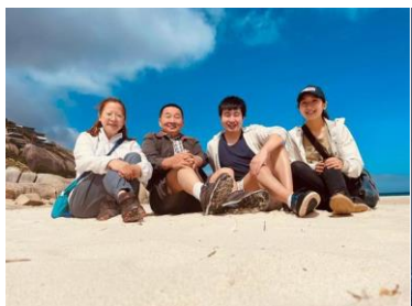
兒子帶我們去新景點