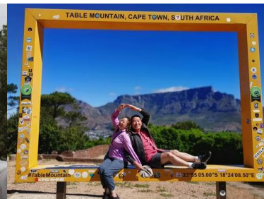
休假五天去爬桌山 / 爬一半 1.5 小時約 500 公尺高