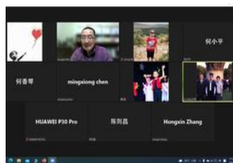
主日晚上線上查經